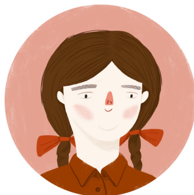
— HELENA ROFE