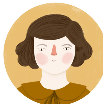
— PANI PASTERZOWA